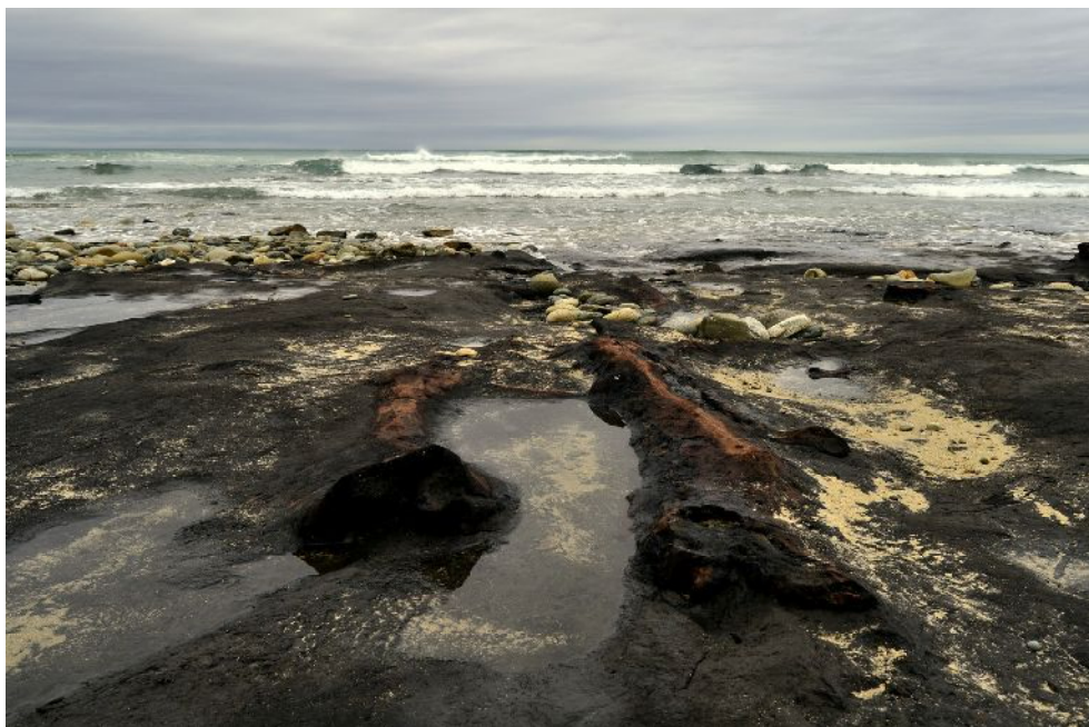
Fig. 4. Bosque de Ponzos

En los últimos 10000 años asistimos a una acelerada subida del nivel del mar con su cohorte de dunas costeras precediéndola. Esta invasión de la costa por trenes de dunas convirtieron la costa en un medio cada vez mas hostil, afectado en las zonas de costa rocosa por las olas y en el resto