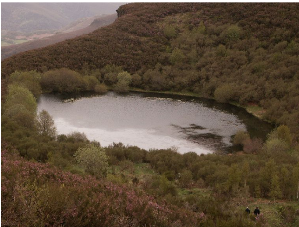
Fig. 1. La laguna de A Lucenza

En el resto de O Courel las cosas eran un poco diferentes a como las vemos en la actualidad. La laguna de A Lucenza, (Fig. 1), una antigua cubeta de sobreexcavación glacial que llegó a alcanzar mas de 10