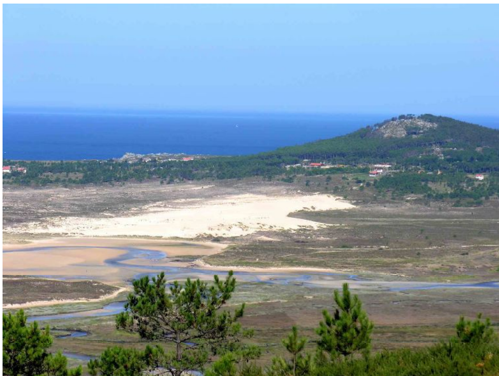
Fig. 5 a,b,c. Las dunas de Corrubedo es un buen ejemplo de como sería la costa gallega hace 9000 años.

Los últimos descubrimientos en especial las espectaculares cuevas descubiertas en zonas graníticas de Galicia (Vaqueiro 2017), han permitido expandir los posibles hábitats cubiertos durante la Prehistoria. Esquemáticamente se pueden distinguir 3 tipos de cuevas no calizas: de fisura, de bloques y cacholas (tafone) (Vidal Romani y Vaqueiro 2007; Vaqueiro 2017). En ellas no se han encontrado restos óseos fósiles debido al factor