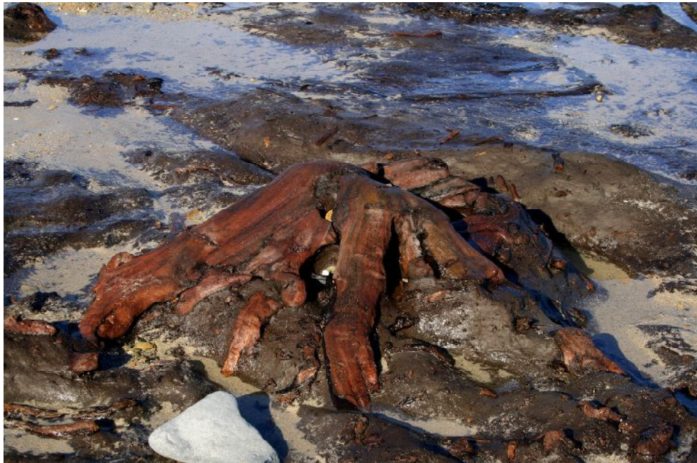
Fig. 3. Bosque de Arealonga

comenzado ya (hacia 5000 años) aunque las rías aun eran valles fluviales (Vidal Romani 2015) pues el mar estaba estacionado en la boca de las rías como prueban los frecuentes hallazgos de restos de bosques fósiles con la misma edad que Elba en zonas como Cíes, Patos (Pontevedra), Sesele, Ponzos (Coruña) y Arealonga (Lugo) (Figs. 3 y 4).